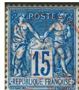
Oblitération encore moins courante, cette oblitération provenant d'un bureau sur un paquebot, ici ORAN A PORT-VENDRES en service mi-1880 à mi-1881.