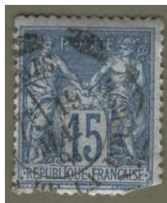
Autre empreinte pas très courante, réalisée par la machine Daguin entre août 1881 et août 1882 à la Recette Principale de Paris.

C'est la période des essais de Paris, même si les divers cachets utilisés "déborderont" sur le N°90 IID.