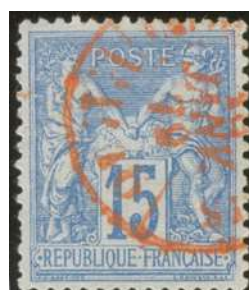
Timbres à date de journaux, moins courant sur les 15 centimes.