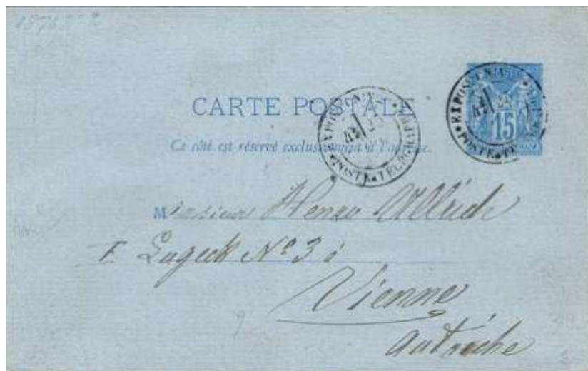
1ere date connue 25 Juillet 1878

L'exposition s'est déroulée de mai à octobre de 1878, les dates ne pourraient être que mai, juin, juillet, août, septembre et octobre, il suffit de superposer « juillet » qui est la date manuscrite, pour constater que les hauts des lettres coïncident bien.