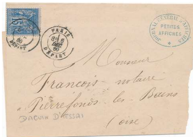
Ce jumelé déposé par une machine anglaise à l'essai dans le bureau principal de Paris est plutôt difficile à trouver.

C'est la période des essais de Paris, même si les divers cachets utilisés "déborderont" sur le N°90 IID.