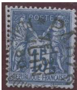
Également quelques essais connus au bureau Place de la Bourse.