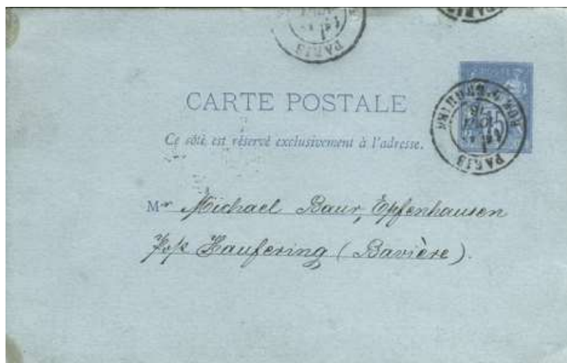
Carte portant un tād commençant par 1, donc 19 août 1878 qui serait déjà une journée de mieux que celle vue par l'ACEP.