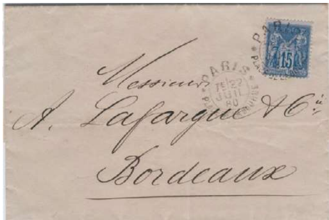
Essai du 22 juillet 1880, assez courant.

Si le timbre de 15c Sage reste courant, certaines oblitérations méritent qu'on les regarde de plus près.